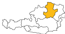
Diözese St. Pölten