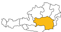
Diözese Graz Seckau